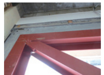
耐震補強充填工事