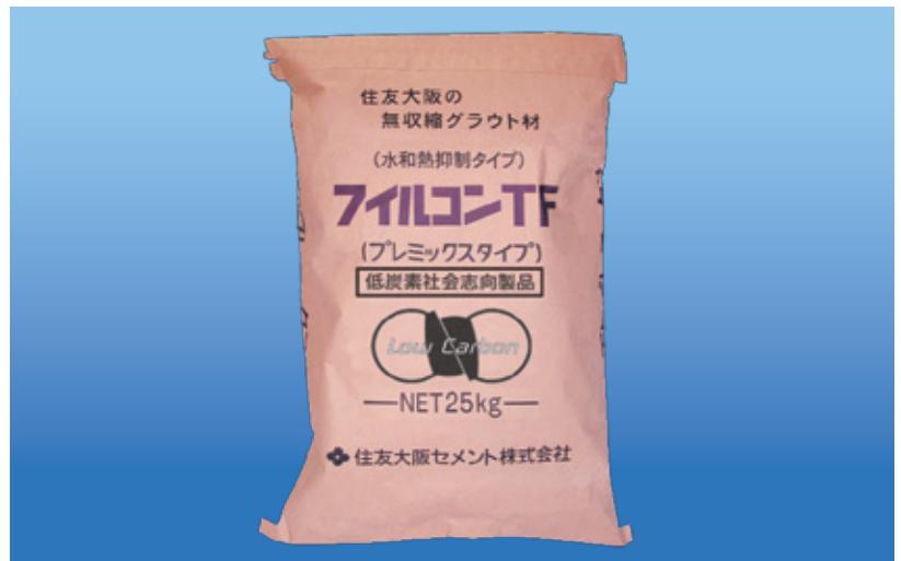
荷姿は製造の都合等により予告なく変更する場合がありますので予めご了承ください。

低炭素・フィルコンTFは、原料セメントの一部に製造時のCO 2 排出量が極めて少ない潜在水硬性材料を配合し、製品全体の排出CO 2 量を従来当社材比で32%削減した、低炭素社会志向の無収縮モルタルです。構造物の環境配慮設計(CASBEE)への取り組みが一般的になりつつある現在、耐震改修等で大きなボリュームを占める充填材自体のCO 2 排出量が低減できることは、工事の環境配慮度合いを評価する際に大きなメリットとなります。さらに当社の材料技術を駆使し、従来品の物理的性能はほぼ維持しながら、CO 2 排出量だけを削減することに成功しています。