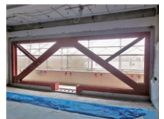
耐震補強充填工事