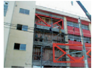
鉄骨ブレース組立