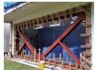
耐震補強充填工事