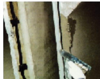
欠損部分进行处理