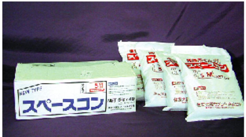
スペースコン ダンボール箱 (5kg×4ピニール小袋) 入り