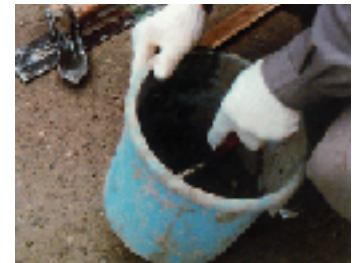
スペースコンと水を混合