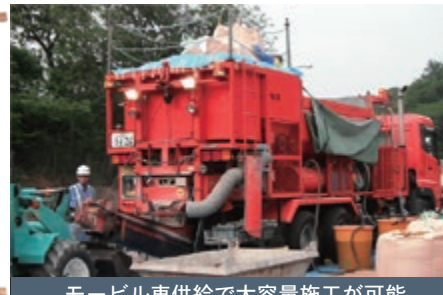
モービル車供給で大容量施工が可能

【荷姿】 上写真左 モルタル(特殊繊維プレミクス) 25kg袋 上写真右 専用骨材25kg袋 荷姿・仕様は予告なく変更することがありますので予めご了承ください。