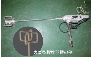
カゴ型攪拌羽根の例