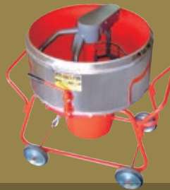
ダマカットミキサー(200V)：岡三機工(株) 200V仕様のミキサを推奨