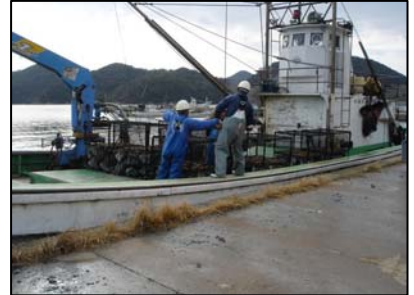
⑥ユニック船積み込み