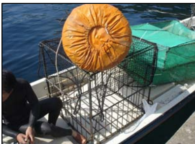
石を入れずに浮き取付