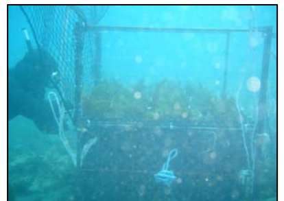
石、海藻、ネットは水中作業

住友大阪セメント株式会社 建材事業部 関連事業グループ 〒102-8465東京都千代田区六番町6-28 電話03-5211-4755 FAX03-3221-5183