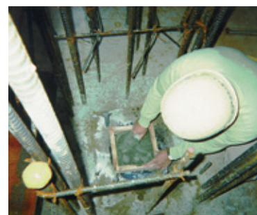
鉄骨柱基礎ベースモルタルの施工状況