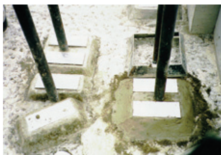
機械基礎/パッドの施工状況