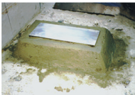
機械基礎/パッドの施工状況