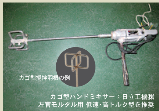
カゴ型ハンドミキサー：日立工機株式会社 左官モルタル用 低速・高トルク型を推奨