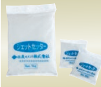
ジェットセッター