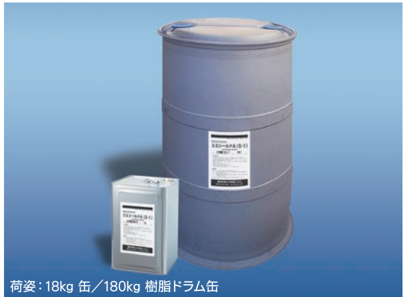
荷姿：18kg 缶／180kg 樹脂ドラム缶