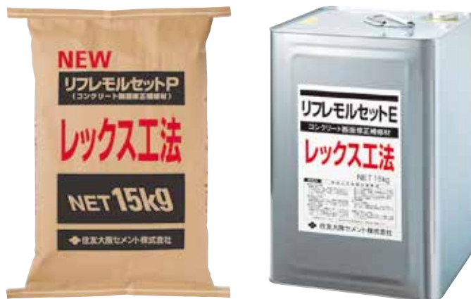
NEWリフレモルセットP 15kg/袋