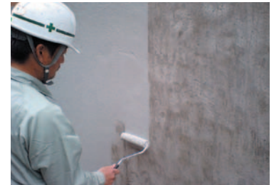
リフレベースW塗布状況 (ローラー施工)