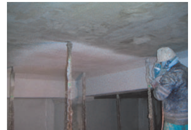
リフレベースW塗布状況 (リシガン吹付け施工)