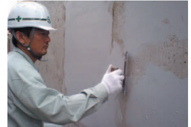
リフレベースWパテ塗布状況