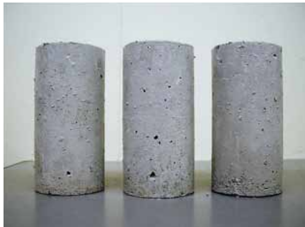
リフレアークLの硫酸浸漬試験後