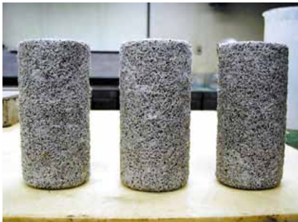
市販断面修復材の硫酸浸漬試験後

使用および取扱いの前に、当製品の安全データシート(SDS)をお読みください。本カタログの記載内容については、予告無しに変更する場合がありますので、予め御了承願います。