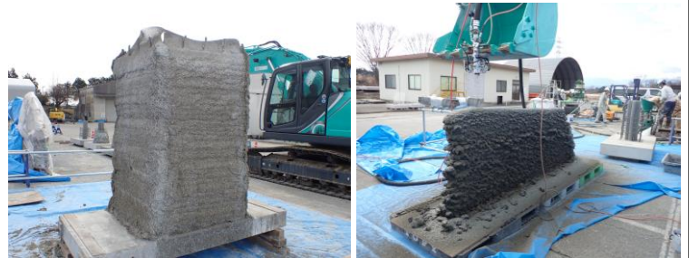
柱(型枠)の造形 (高さ約1.5m)

ICT建機のバケットに吹付ノズルを取付け、無限の平面設計データを作成・入力し、 水平軸を制御 した。また、 高さ については オフセット機能 （スイッチにより設定した高さ分を上げ下げ可能な機能）により調整を行った。これらのICT建機技術を活用し、壁や埋設型枠を 直接プリント造形 することに成功した（施工総研構内にて実施）。