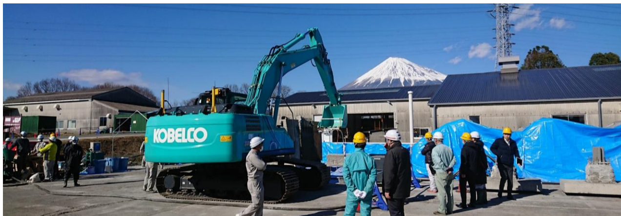
新開発のハイブリッド吹付けシステムを取付けたICT建機による直接プリント造形